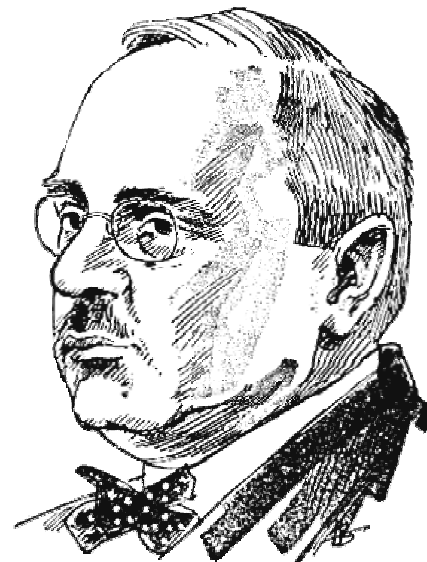
Abbildung 1: Alfred Adler begründete die Individualpsychologie. Er distanzierte sich von Freuds analytischer Sicht und betonte, dass der Mensch als unteilbare Ganzheit zu sehen sei

Modelle, auch Denkmodelle, bleiben immer nur vereinfachte Abbilder der Wirklichkeit und werden nie wirklich „alle“ Wirkfaktoren mit einbeziehen können. Aber wir können unsere Auffassungen und Wahrnehmungen immer weiter verbessern, indem wir sie durch weitere Betrachtungsebenen vervollständigen. Sicherheit, dass wir wirklich das „Ganze“ erfassen und berücksichtigen, können wir allerdings nie haben. So bleibt die „Ganzheitlichkeit“ eine Utopie. Das Streben nach Ganzheitlichkeit kann uns höchstens dazu bringen, „mehr“ Ebenen zu erfassen und zu berücksichtigen. Das ermöglicht einen besseren, gerechteren Blick auf die Verfassung des Teilnehmers, Klienten oder Patienten. Wir können ihn besser verstehen und besser erreichen.